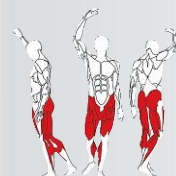
ZONA INFERIOR LOWER BODY