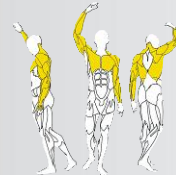
ZONA SUPERIOR UPPER BODY